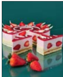
Str: 98 Skutna torta z jagodami