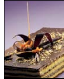
Str: 102 Torta čoko-oreh