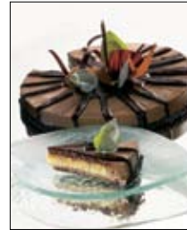
Str: 106 Torta s čokolado in baziliko