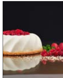
Str: 100 Smetanova torta s sezamom in rdečim sadjem