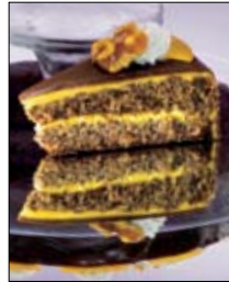
Str: 87 Pomarančna torta z orehi in čokolado