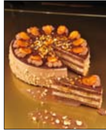
Str: 82 Nutelina torta z bananami