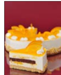
Str: 122 Torta z grškim jogurtom in pomarančo