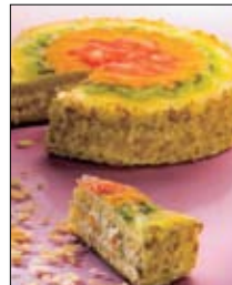
Str: 96 Sadna torta