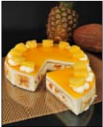
Str: 84 Pina colada musse torta