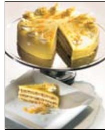
Str: 88 Pomladna bezgova torta