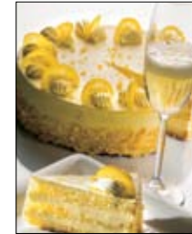
Str: 110 Torta s pečnim vinom