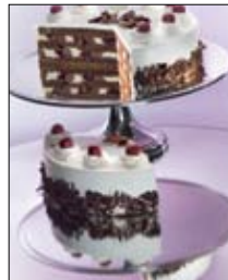
Str: 99 Smetanova torta s čokolado in višnjami