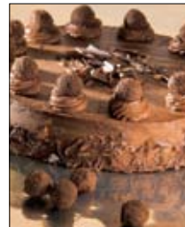
Str: 116 Torta truffel