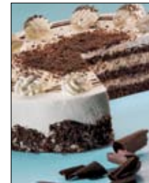
Str: 114 Torta stracatela