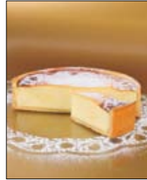
Str: 83 Pečena skutna torta