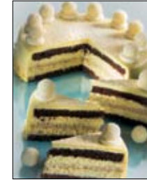
Str: 104 Torta rafaelo