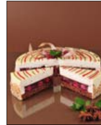
Str: 107 Torta s čokolado, malinami in janežem