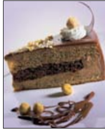
Str: 80 Nugatova torta s praženimi lešniki