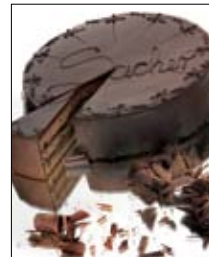
Str: 111 Torta sacher