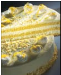
Str: 97 Skutna torta