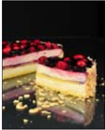
Str: 78 Mascarponejeva torta z gozdnimi sadeži