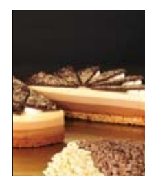
Str: 115 Torta treh čokolad