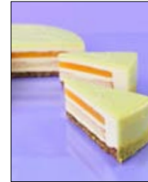
Str: 108 Torta s kremo iz oljčnega olja