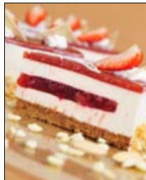
Str: 92 Rabarbarina torta z jagodami in jogurtom