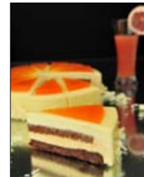
Str: 120 Torta z grenivko in belo čokolado