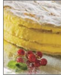
Str: 101 Tisočistna torta