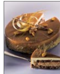
Str: 118 Torta z belo čokolado in arašidi