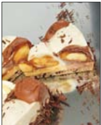
Str: 90 Profiterol torta