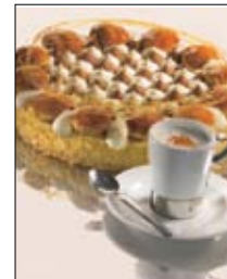
Str: 112 Torta saint honore