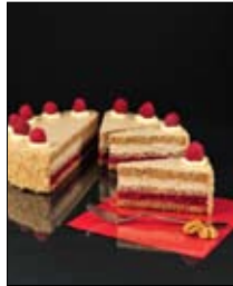
Str: 86 Pirina torta z orehi, malinami in smetano